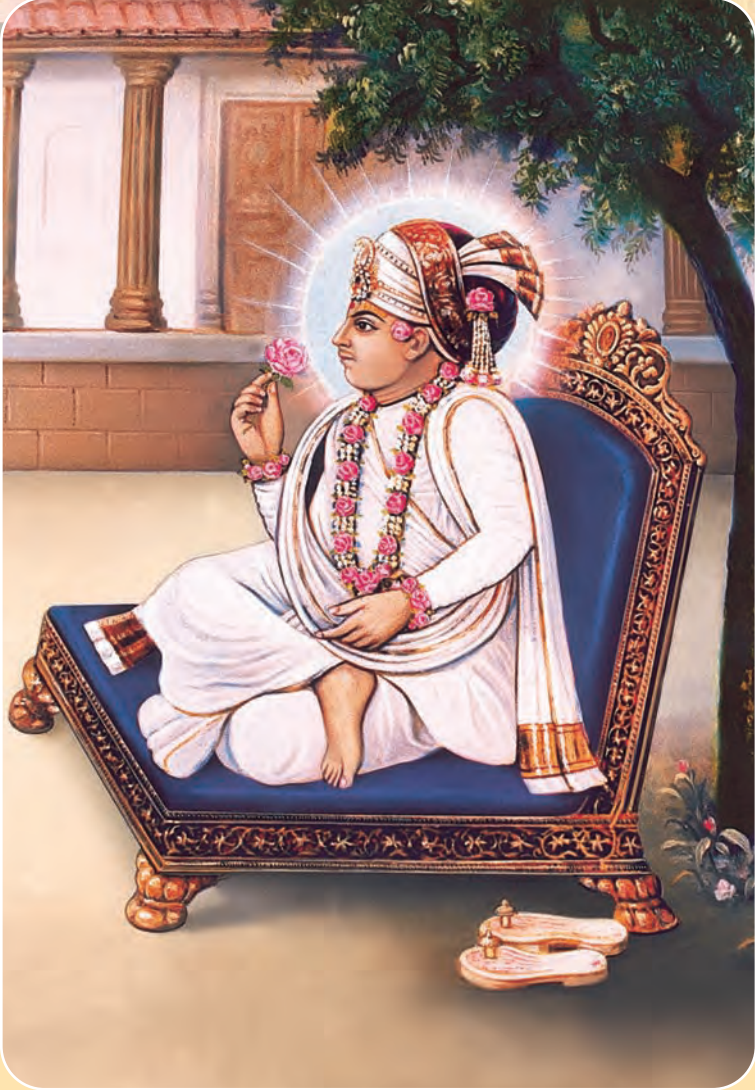
सर्वोपरी ँपास्य मूर्ति पूरुषोत्तम श्री स्वाभिनारायण लगवान