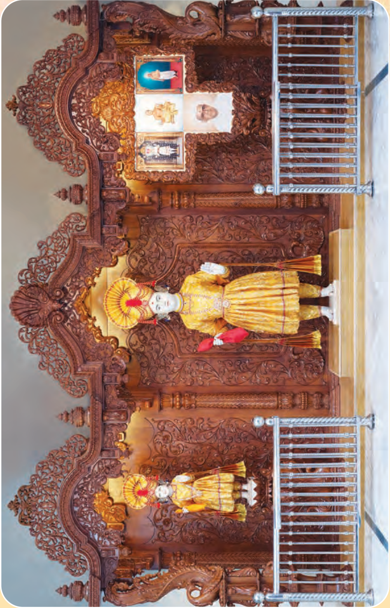
ज्ञान - ध्यान - उपासना भंड - ( अढेनो )